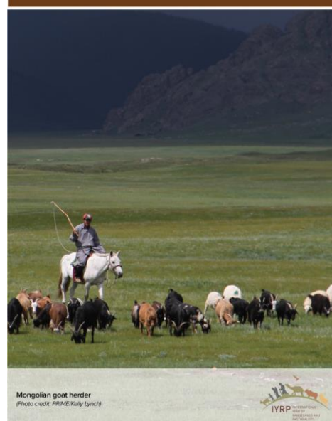
Mongolian goat herder